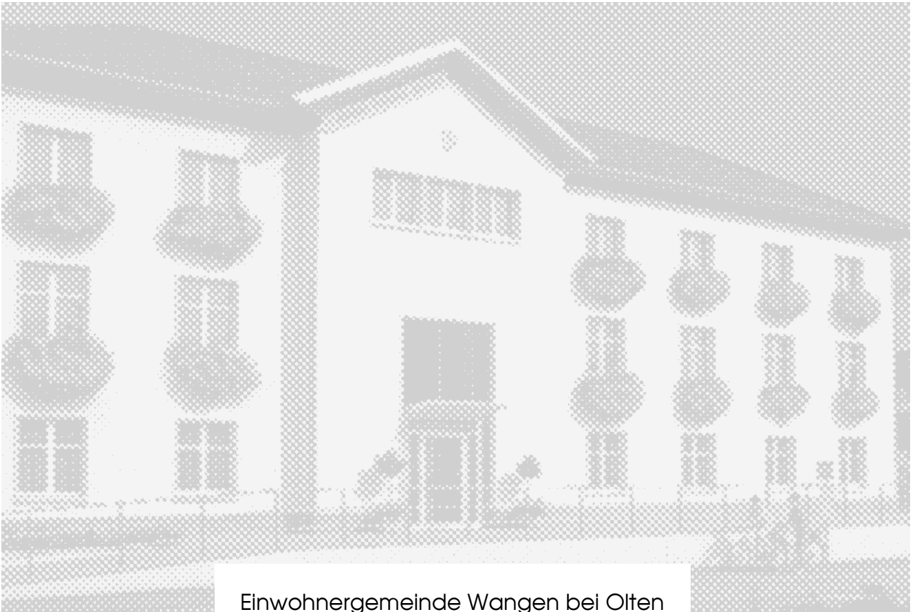
Einwohnergemeinde Wangen bei Olten