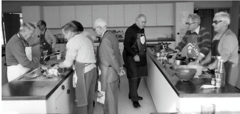
10 Männer nahmen am Kochkurs teil.