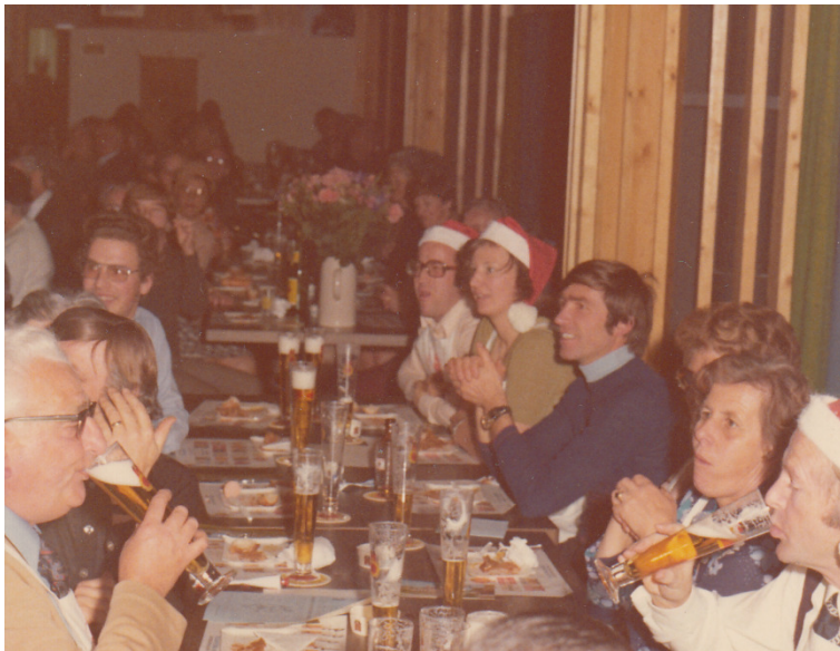
Das Schwyzerörgeli-Quartett des Zugpersonals Basel eröffnete im grossen Festsaal der Brauerei mit lüpfiger und urchiger Volksmusik den gemütlichen zweiten Teil.