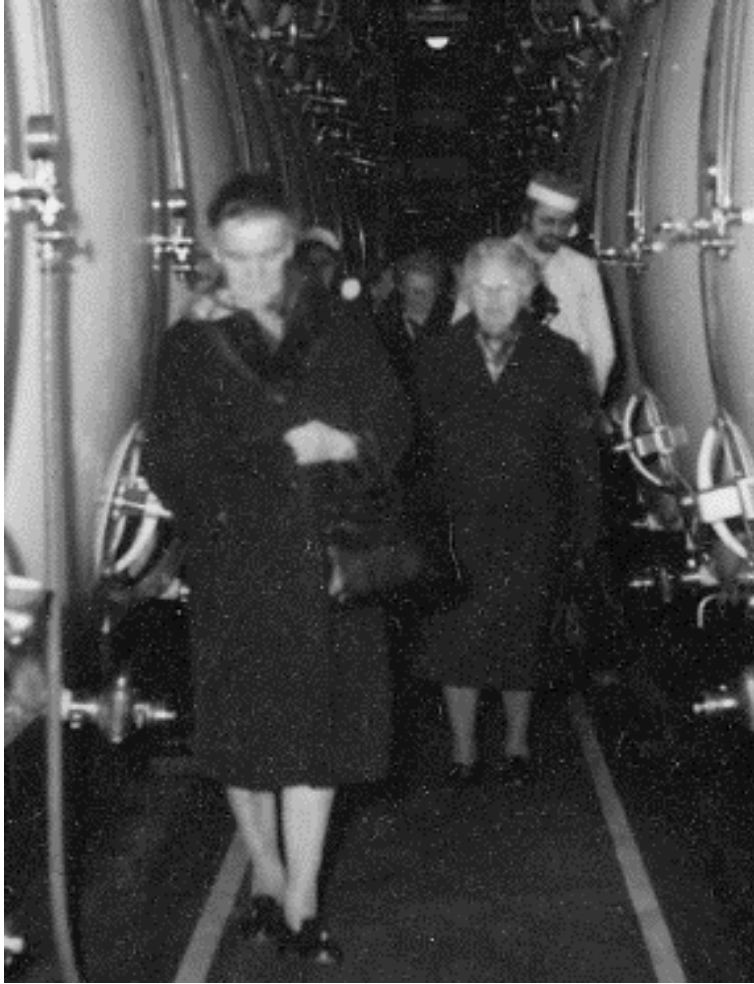
Auf dem Rundgang.