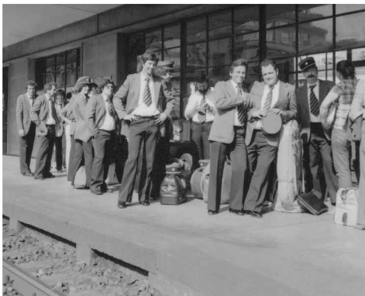
Warten auf den Zug.

Im September 1980 unternahm die Musikgesellschaft eine Vereinsreise. Ziel des Ausflugs war die Gemeinde Wiler im Lötschental VS; jenes Dorf in dem man beabsichtigte ein gemeindeeigenes Jugend-, Sport- und Vereinshaus zu bauen. Der zweitägige Ausflug führte mit dem Zug via Solothurn, Biel, Neuenburg nach Lausanne. Nach einer Rundfahrt auf dem Lac Léman und einem Mittagessen in Montreux ging die Fahrt weiter ins Wallis.