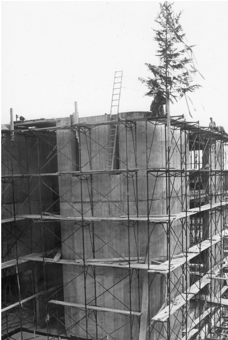
Etwas Spezielles ist bei jedem Bau die Aufrichte.