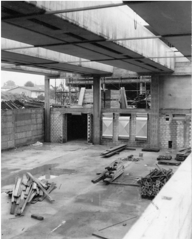
Blick in die Turnhalle (September 1975)